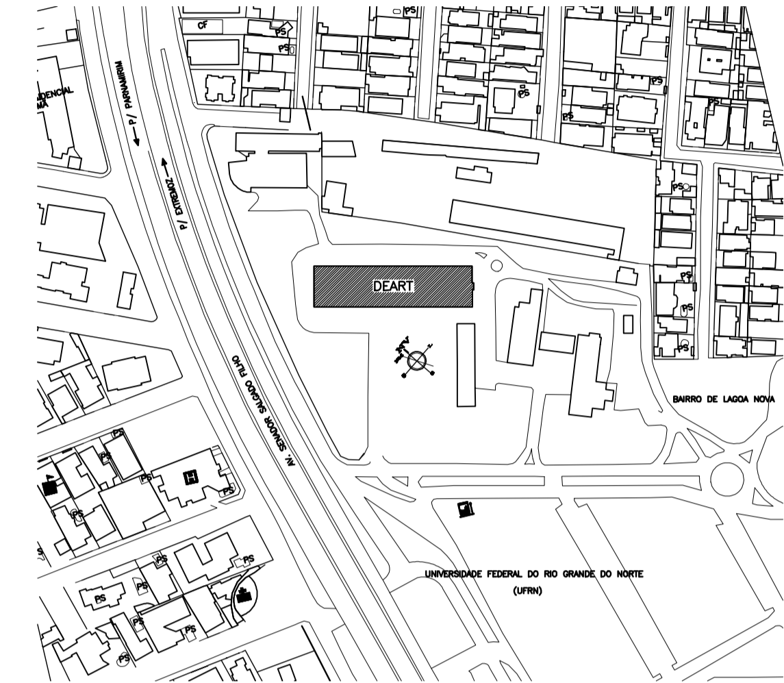
PLANTA DE SITUAÇÃO ESCALA 1/12500